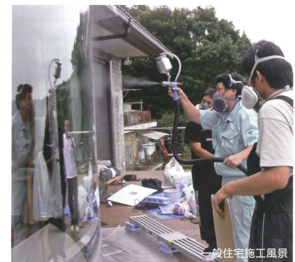
一般住宅施工風景

フィルムが貼れない金網入りガラス、曲面ガラス、巨大ガ ラス、すりガラス等、さらには屋内・屋外、どちらにも施工が可 能です。